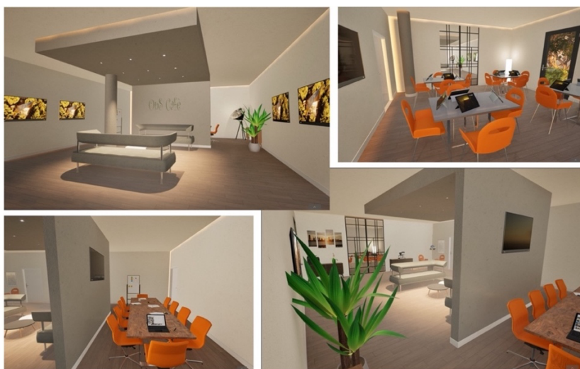
A cura di: Arch. Andrea Coppola

VIDEO DEL RENDERING: Video OpS Cafè final BREVE.mp4